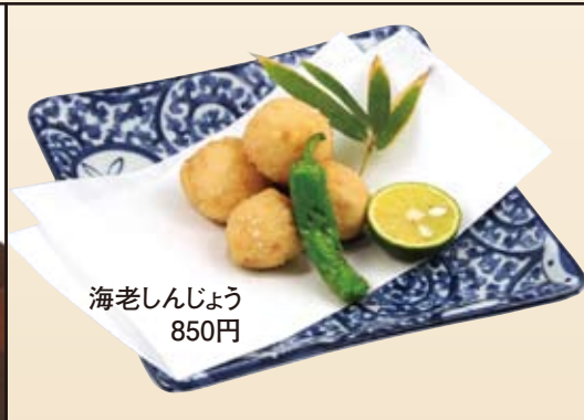
海老しんじょう 850円