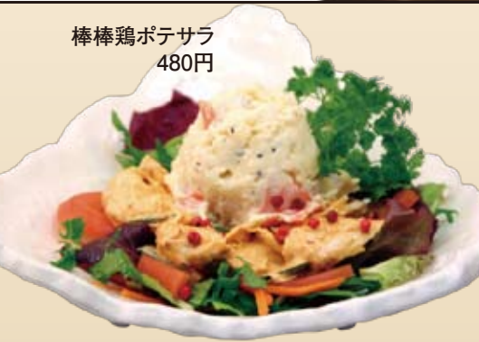
棒棒鶏ポテサラ 480円