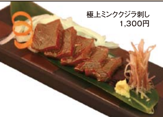
極上ミンクジラ刺し 1,300円

これから益々鍋料理が美味しくなる季節。 くいものや旬では、ご予算に応じた各種鍋料理をご用意いたしております。 お気軽にご相談ください。