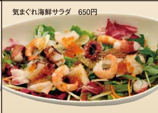
気まぐれ海鮮サラダ 650円