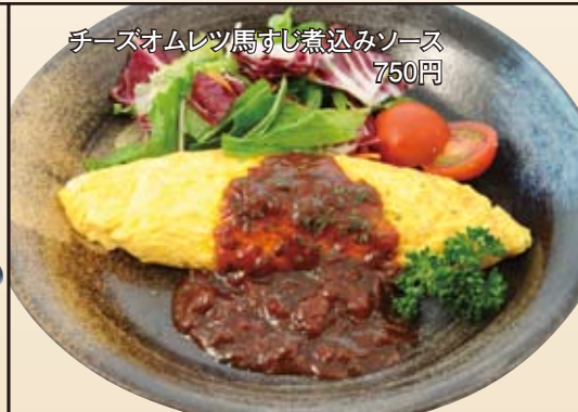
チーズオムレツ馬すじ煮込みソース 750円