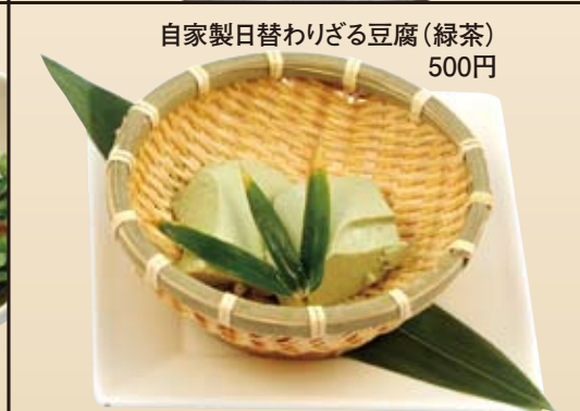
自家製日替わりざる豆腐(緑茶) 500円